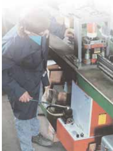
Работа с гидравлическим прессом