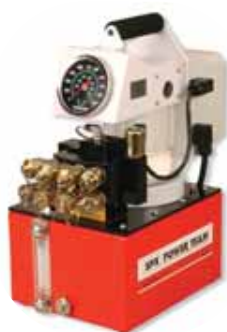
PE55TWP Применение с гайковертом См. стр. 161