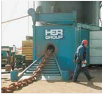
Применение насоса PE4004S с цилиндром RD3006 на специальном прессе для ремонта поврежденных звеньев цепи для судостроительной промышленности.