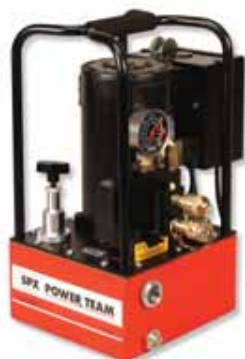
PE30TWP Применяется с гайковёртом См. стр. 161