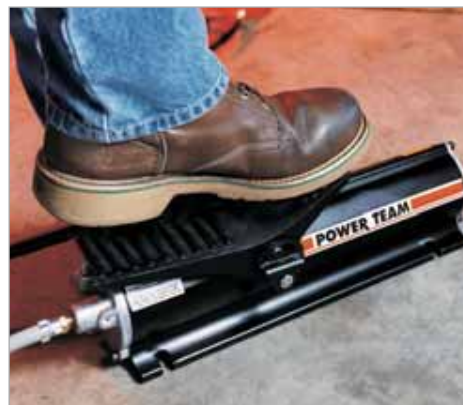
PA9 с ножной pedalью