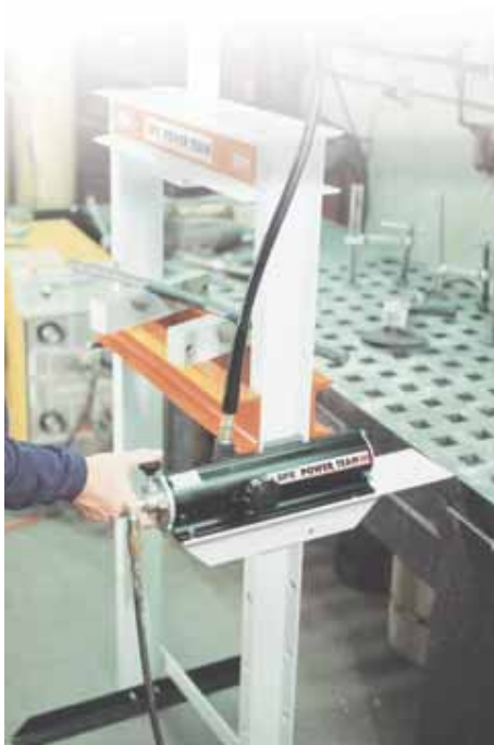
Насос РА9Н с ручным управлением, используемый в качестве привода для выпрямляющего пресса.