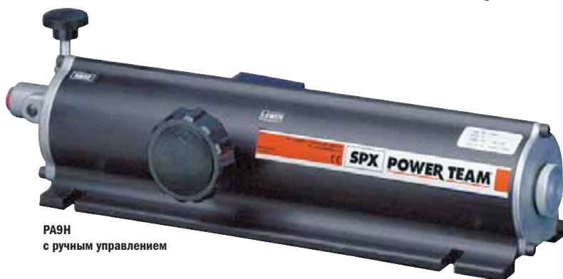
РА9Н с ручным управлением