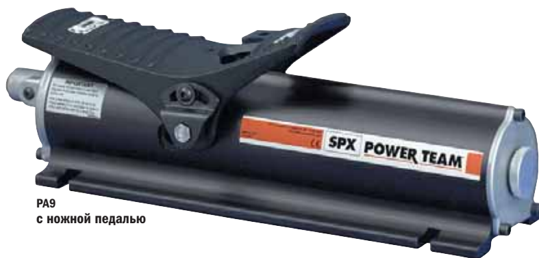
РА9 с ножной педалью