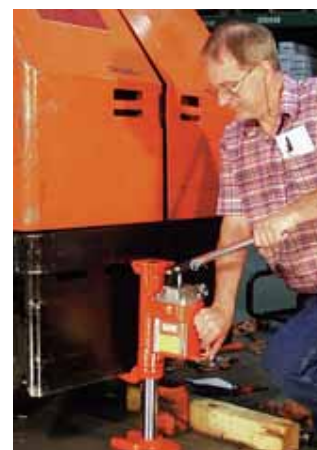
Сверхпрочный упорный домкрат серии J используется для обслуживания грузовика